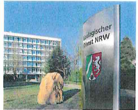
Geologischer Dienst NRW in Krefeld

Über die geplanten bodenkundlichen Kartierungen werden die betroffenen Kreisverwaltungen sowie die zuständigen Landwirtschaftskammern und Regionalforstämter rechtzeitig schriftlich informiert. In der Regel werden die Informationen im Amtsblatt oder durch Aushang veröffentlicht. Es wird um Verständnis dafür gebeten, dass eine persönliche Unterrichtung bei der Vielzahl von Grundstückseigentümer*innen oft nicht möglich ist.