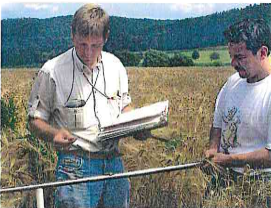
Beurteilung der Bodeneigenschaften durch den Geologischen Dienst

Danach sind die Mitarbeiter*innen und Beauftragten des Geologischen Dienstes NRW berechtigt, Grundstücke – nicht die Gebäude – zu betreten und die notwendigen Arbeiten vorzunehmen. Auf forstliche und landwirtschaftliche Belange und die Nutzung der Grundstücke wird soweit wie möglich Rücksicht genommen. Falls trotzdem durch die Arbeiten Schäden entstehen, werden diese nach den allgemeinen gesetzlichen Bestimmungen ersetzt.