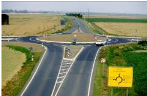
Bild 1 und 2: Diese einfache und zweckdienliche Ausführungsart entspricht der Standardausführung