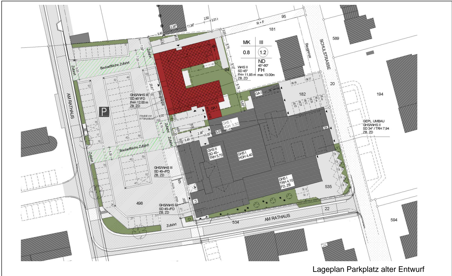
Lageplan Parkplatz alter Entwurf

Errichtung eines Wohn- u. Geschäftshauses Umgestaltung Parkplatz „Am Rathaus“