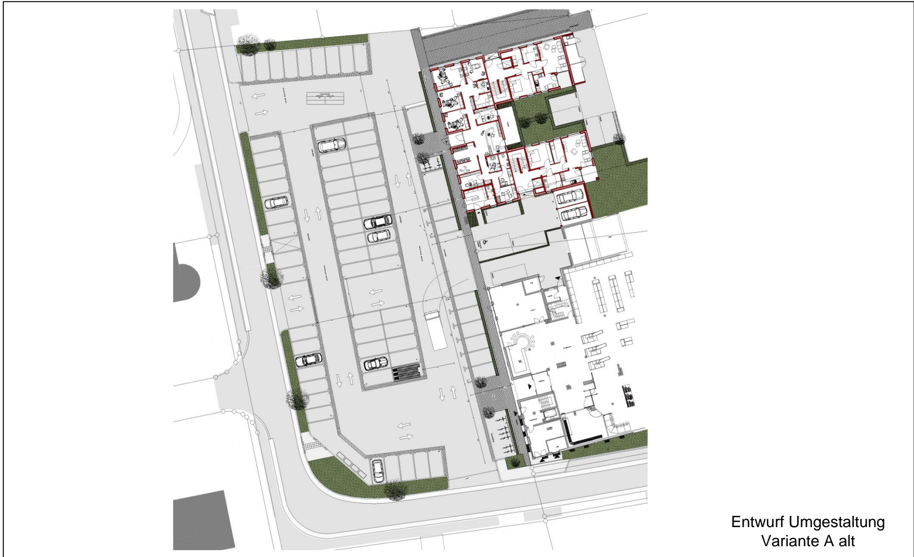
Entwurf Umgestaltung Variante A alt

Errichtung eines Wohn- u. Geschäftshauses Umgestaltung Parkplatz „Am Rathaus“