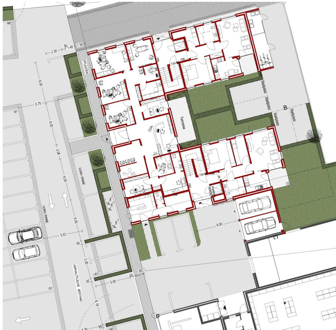
Entwurf Umgestaltung neu Ausschnitt vor Neubau

Errichtung eines Wohn- u. Geschäftshauses Umgestaltung Parkplatz „Am Rathaus“