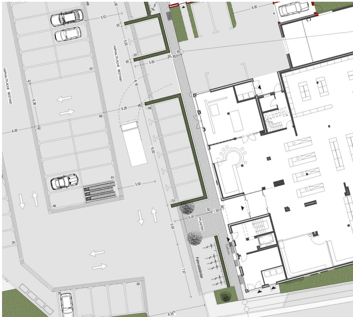
Entwurf Umgestaltung neu Ausschnitt vorm K+K-Markt

Errichtung eines Wohn- u. Geschäftshauses Umgestaltung Parkplatz „Am Rathaus“