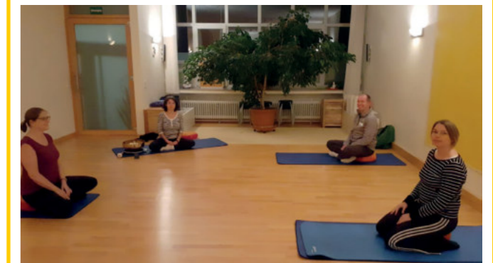
Wie mit einer Prise Ohmmmmmmmm die Work-Life-Balance erhalten oder wieder zurückgewonnen werden kann, das erfuhren die Teilnehmerinnen beim "Yoga-Schnupperabend" im Studio Einklang.

Damit traf sie offenbar einen Nerv. Die Nachfrage war überwältigend, so dass zwei Termine angeboten werden mussten. Während der erste Termin noch im Januar stattfinden konnte, musste der zweite "Yoga-Schnupperabend" coronabedingt bis nach den Sommerferien verschoben werden.