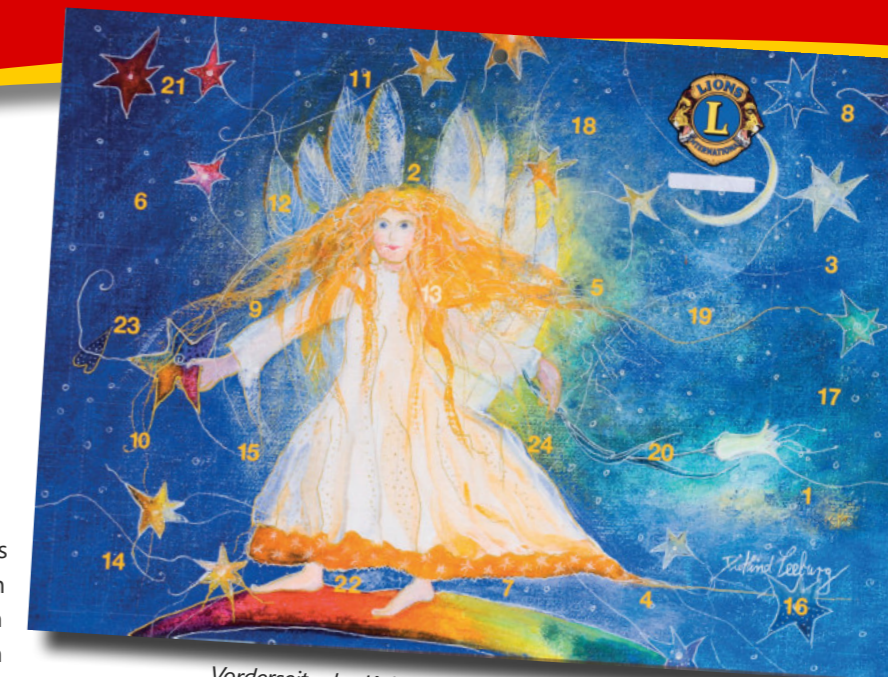
Vorderseite des Kalenders

Der Lions Club Ostbevern hat sich – neben der Beteiligung an den humanitären Projekten der internationalen Lions-Organisation – vor allem der Unterstützung benachteiligter Menschen aus unserer Region verschrieben. Daher kommt der Erlös aus der Kalender-Aktion auch