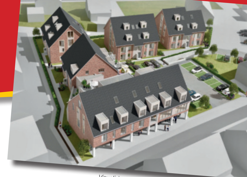
Visualisierung Bever-Carré | Wecker Immobilie e.K.