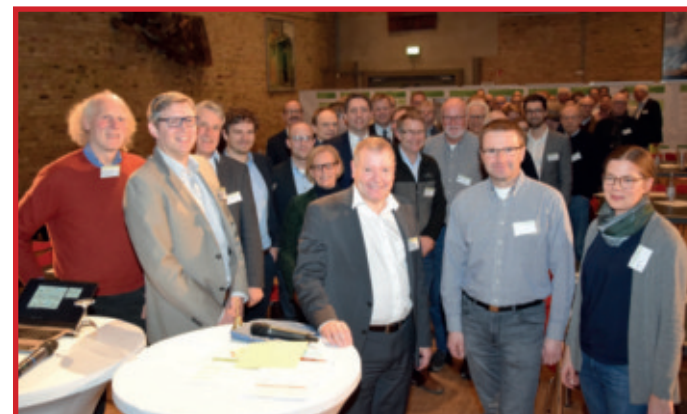
Zur konstituierenden Sitzung des Beirates trafen sich am Aschermittwoch die Beiratsmitglieder aus 12 Kommunen im Grevenener Ballenlager.