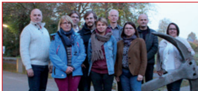
Reichen den Jugendlichen die Hand und bieten ein gemeinsames Gespräch an, wie sich die Situation verbessern lässt. Das Team, bestehend aus Jugendamt, Ordnungsamt, Kinder- und Jugendwerk sowie Sicherheitsdienst.

Jugendlichen ins Gespräch kommen, um Lösungen zu finden. Unter dem Motto "Wir möchten einen schönen Sommer 2020" laden Sie deshalb alle Jugendlichen zu einem Austausch am Freitag, 29. November 2019 um 16.30 Uhr ins Kinder- und Jugendcafé Ostbevern, Lienener Damm 36 b , ein. Dabei soll es nicht um Anklagen oder Beschuldigungen gehen, sondern um einen kritischen Diskurs, wie es gelingen kann, dass Jugendliche sich auch weiterhin draußen auf Spielplätzen, an den Schulen oder an der BEVER treffen können, ohne dass hinterher Vandalismusschäden oder vermüllte Plätze zu beklagen sind.