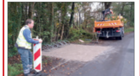
Errichtung einer neuen Bushaltestelle am Bahnhof