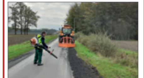
Erneuerung von Bankettstreifen im Außenbereich